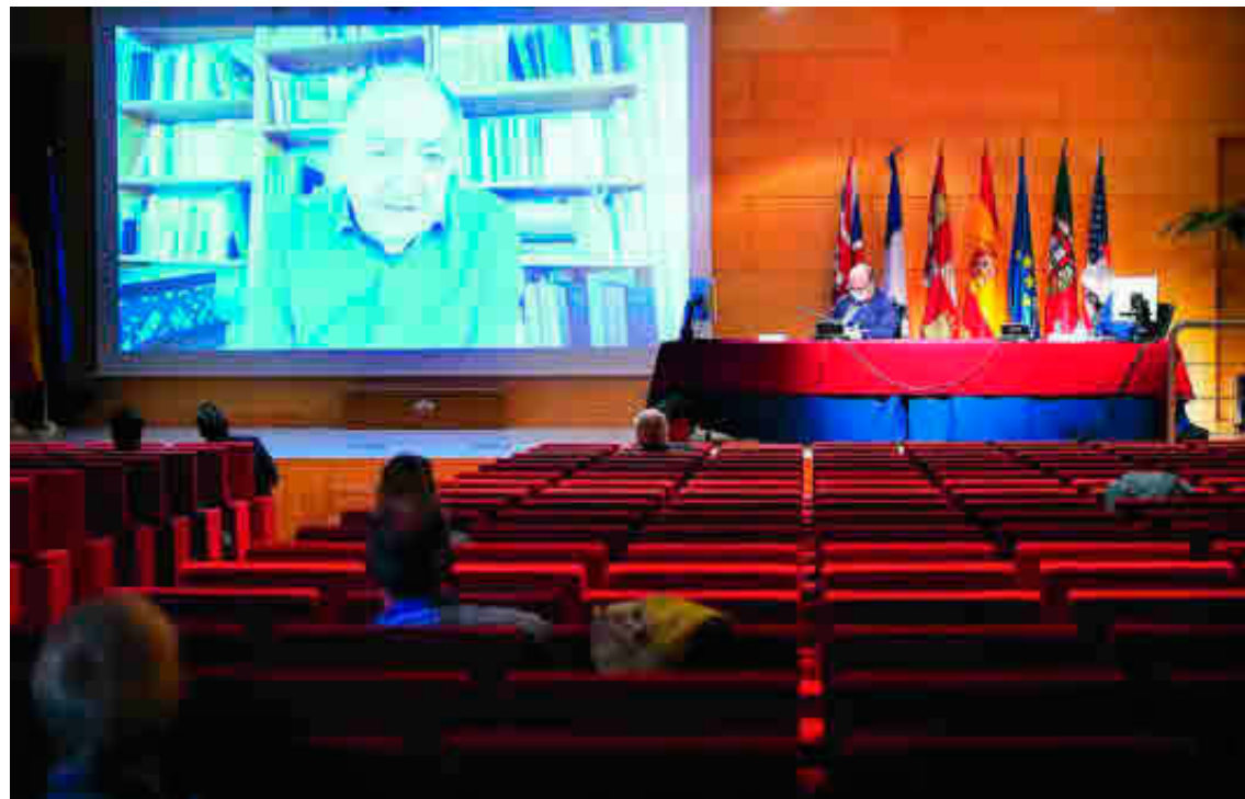
Primera jornada del Congreso

Ésta es una de las conclusiones del exitoso Congreso Internacional celebrado en el mes de mayo con los primeros nombres de la investigación y las principales universidades del mundo