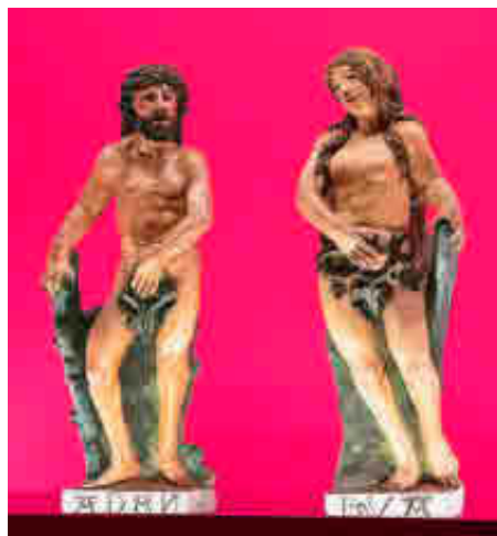
Figuras de Adán y Eva