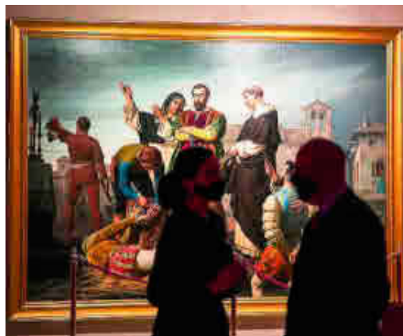
«Los Comuneros en el patíbulo», de Antonio Gisbert