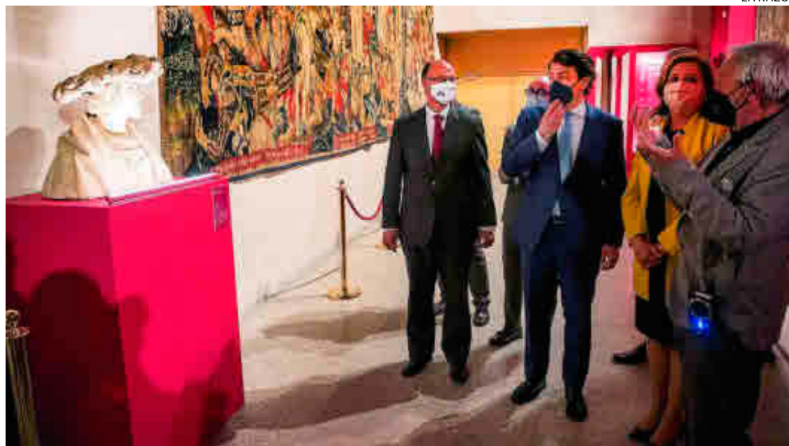
El presidente de la Junta, Alfonso Fernández Mañueco, visita la muestra junto a Luis Fuentes

Gran acogida a una exposición que han visitado más de 8.000 personas y con gran repercusión internacional