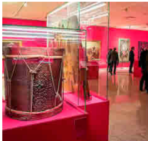
Algunas de las joyas que han podido verse