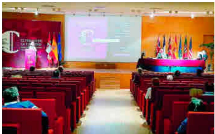
Congreso «El tiempo de la libertad. Comuneros V Centenario»